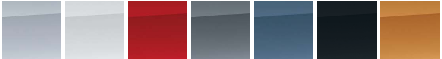
Plata Blanco Rojo Gris Aqua Hatchback solamente Negro Naranja